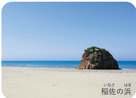
いなさ はま 稲佐の浜