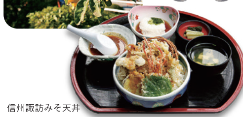
信州諏訪みそ天井