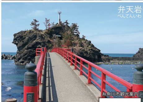
弁天岩 べんてんいわ