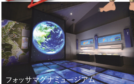
フォッサマグナミュージアム