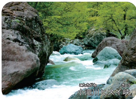
こたなかの 小滝川ヒスイ峡