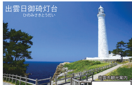
出雲日御碕灯台 ひのみさきとうだい